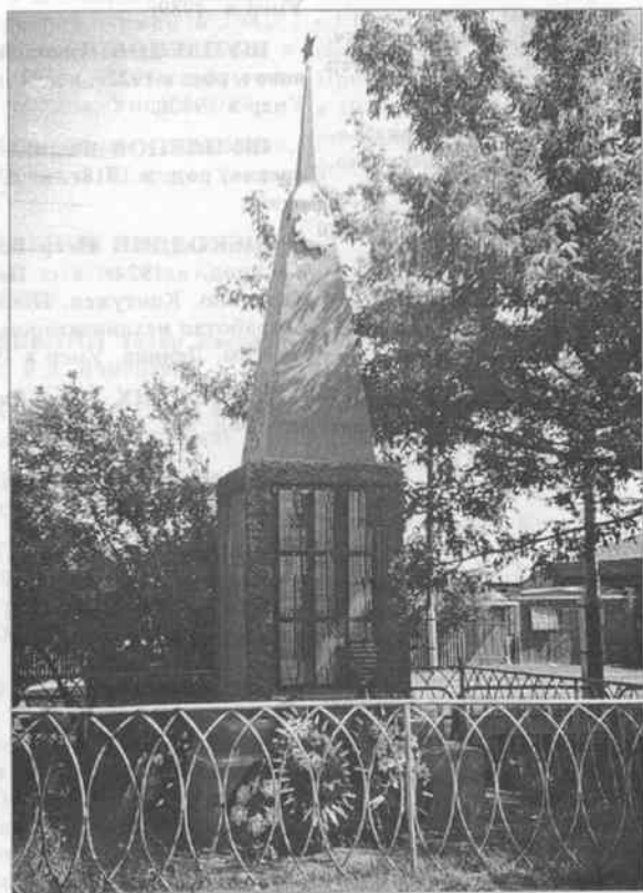
МЕРМЯКИНО. Памятник А. С. Пушкину, 1926 г. (скульптор В. М. Шерин). Уничтожен в 1928 г.